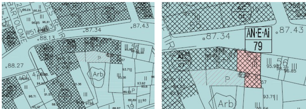
Plano O-AN-1-02 de las NN.SS. vigentes y propuesta de modificación.

Se modifican los planos O-AN-1-00, O-AN-1-02 y O-AN-1-04 con la finalidad de calificar equipamientos públicos existentes.